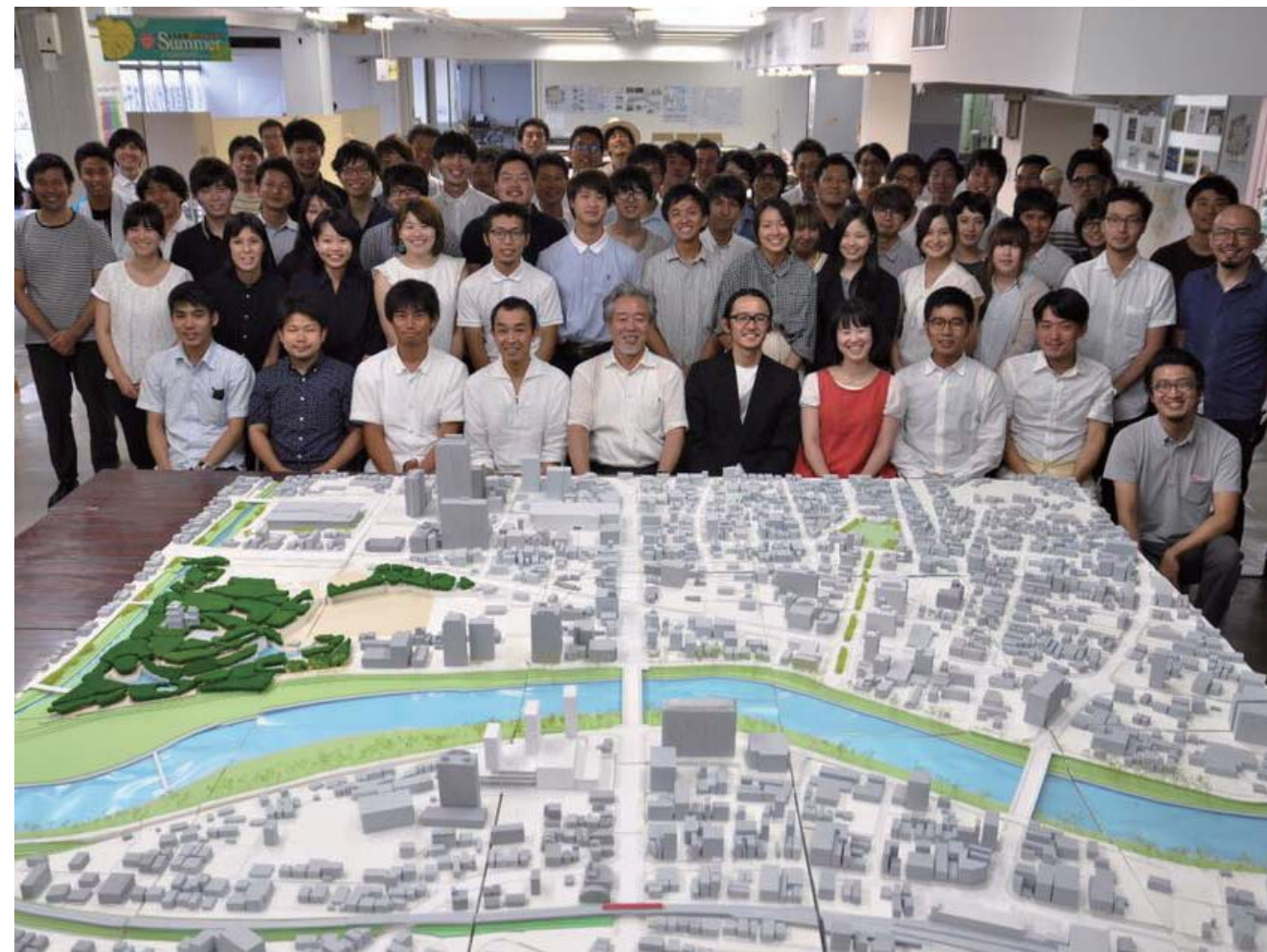
▲ 県内の大学生が中心となって乙川周辺地区の空間活用を提案する短期集中型ワークショップ「デザインシャレット」。参加者の市民の皆さんとチューターの先生方と学生の集合写真。

そんな中、この地に再び輝きを取り戻すべく「おとがわプロジェクト」が始動しました。川とともにあった岡崎市の景観・生活文化をあらためて見つめなおしつつ、官民一丸となって岡崎の潜在的・顕在的資源を生かした新しい「都市の風格」づくりに挑む、5年間のチャレンジ。その初年度の取り組みをりたの目線でご紹介します。