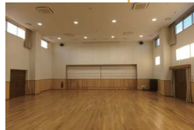
舞台を備えたホール仕様の活動室