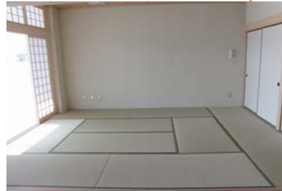
着付教室や集会に適した和室仕様の活動室