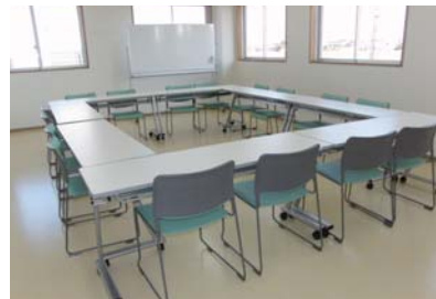
会議などに適した活動室