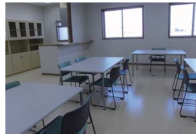
水場があり創作活動に適した活動室

岡崎市の南西端に位置する六ツ美地域の新しい地域交流センターが全館オープン。平成25年に開館した歴史文化伝承ゾーン「六ツ美歴史民俗資料室」に続き、地域交流ゾーンの各種活動室や印刷作業室もご利用いただけるようになりました。また、そうした貸出設備だけでなく、市民活動ステーションでは活動のご相談や団体のご紹介、ボランティアのマッチングなども行い、みなさんの活動をサポートできる施設を目指します。ぜひご利用ください。