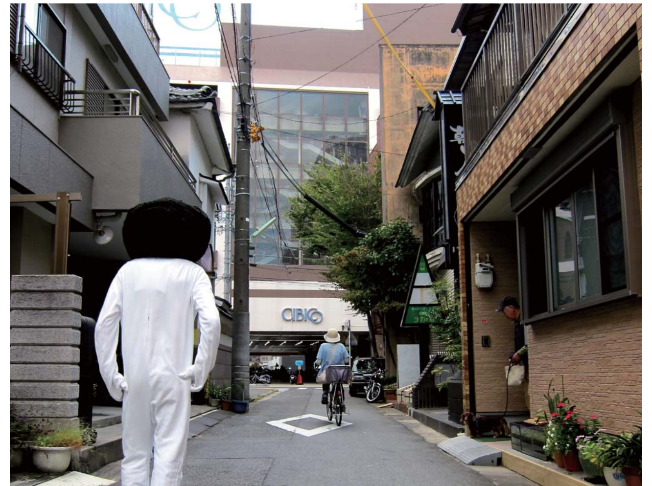
▲何気ない景色に重なる「江戸(二十七曲り)」と「昭和(シビコ)」と「平成(オカザえもん)」。この景観を未来にどう手渡すかは、今を生きる私たちに委ねられている。