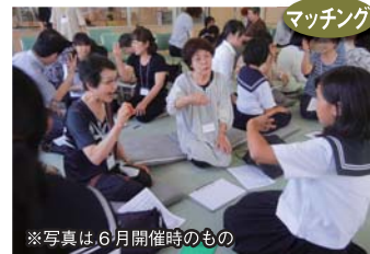
※写真は、6月開催時のもの

岡崎聾学校の生徒さんを講師に実施。受講者生徒さん双方から大変よい感想をいただき、聾学校と地域との関係づくりのきっかけをつくることができました。