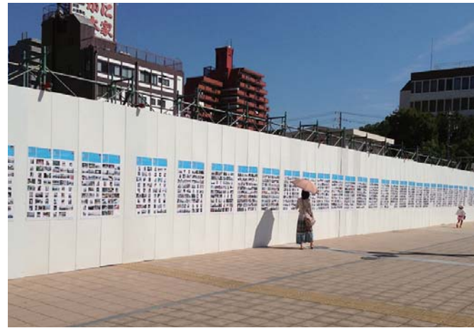
▲「岡崎百人百景展示会(2013)」約2,700枚の写真を展示 旧セルビ解体工事現場仮囲いにて

昨年度、あいちトリエンナーレ2013「まちトリ」企画の一環として、「岡崎百人百景」というイベントを開催しました(協力:ギャラリーエークウッド、協賛:富士フィルム株式会社)。参加者100人に1台ずつ配付したレンズ付きフィルム「写ルンです。27枚撮り」で、戦災復興エリア(康生地区周辺)内の魅力的な風景や気になるものを撮影していただき、それを展示するという企画です。「岡崎百人百景」は、景観まちづくりの啓発効果が非常に高く、参加者からも好評だったことから、今年度、対象地域を岡崎市全域に広げ、東西南北と中央の5地区において、各地区100人、総勢500人で岡崎の魅力を掘り尽くす「百景大撮影会」を、りたが運営する各地域交流センター、およびりぶら市民活動センターの事業として行っています。