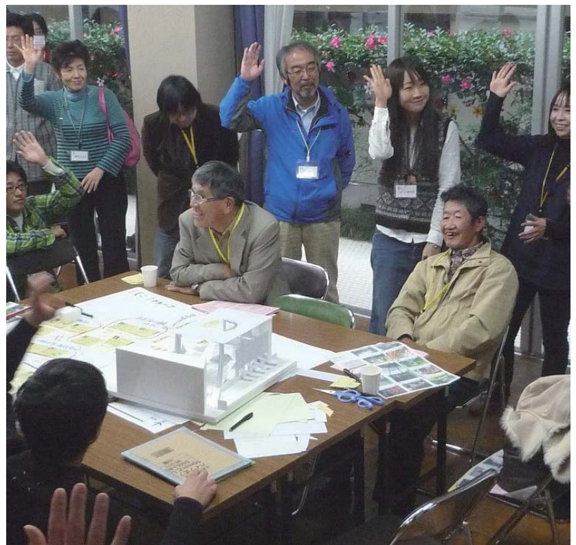
東岡崎駅北口にぎわい広場ワークショップより

地域交流センターの管理運営に当たり、利用者の皆さん、地域の皆さんの声を反映して、さらに魅力的な事業実施が出来ればと考え、3月20日、25日、26日の3日間に渡って、南部、西部、北部、それぞれのセンターで「運営懇談会」を開催します。1年間の活動成果を報告し、次年度への方向性を話し合う場です。(詳細は4pの記事を参照) どなたでも自由に参加いただけますので、お気軽にご来場いただければと思います。