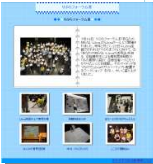
▼「活動紹介」のページ