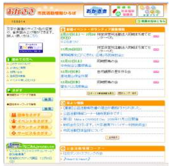
▲「おかざき市民活動情報ひろば」のトップページ

その支援施策の一つとして「情報ひろば」による情報の受発信のサービスを実施しています。