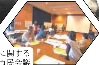
◆ 旧本多邸に関する市民会議