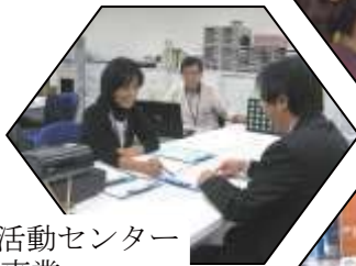
◆ 市民活動センター運営事業