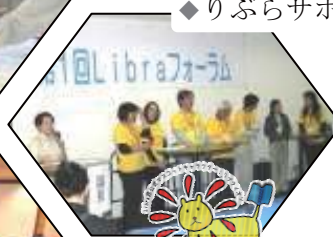
◆ りぶらサポーター支援業務