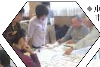
◆ 東部地域交流センター市民検討会議