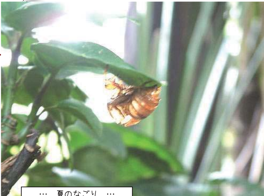
… 夏のなごり …

岡崎市北部地域でまちづくり活動をされている皆さんによる発表交流を行なう集いを、8月29日になごみんで実施しました。市内のエリア単位での活動交流の情報や活性化に役立てばと願っています。今後他の地域交流センター単位での発表交流の集いも企画したいと考えていますので、お楽しみに!