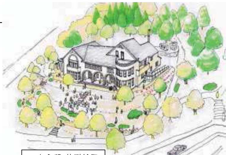
旧本多邸 俯瞰絵図

——当然浮かぶ疑問でしょう。 まず、旧本多邸が岡崎市に寄贈 されるに至った経緯をご紹介します。