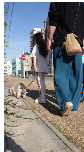
▲私と娘二人で散歩中。下の娘はわんちゃんにずっと声をかけています(笑)