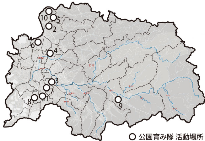
○ 公園育み隊 活動場所

が積極的に行われており、その結果「地域住民が喜んだり、感謝してくれる」「地域住民の関係性の広がり」と深まりが生まれた「公園への愛着が育まれ、公園が地域住民の居場所になった」という成果が生まれていることがわかりました。